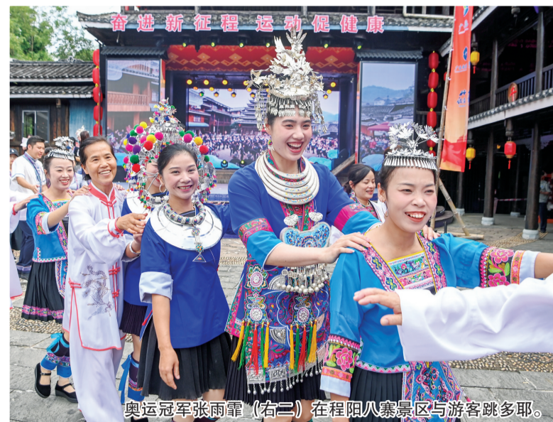
奥运冠军张雨霏(右二)在程阳八寨景区与游客跳多耶。