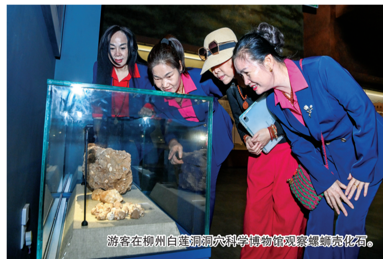
游客在柳州白莲洞洞穴科学博物馆观察螺蛳壳化石。