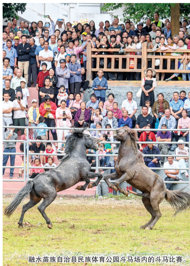
融水苗族自治县民族体育公园斗马场内的斗马比赛。

从剧场里的沉浸式演出，到景区里的非遗技艺体验；从各类“村字号”的文旅盛宴，到文博馆里的数字漫游……当前，柳州这座全国文明城市正进一步满足人们“看景、知史、体验”的旅游需求，文旅产业发展蓬勃兴旺。