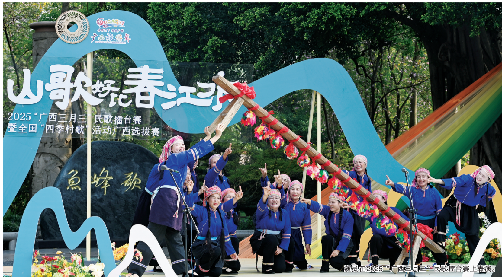
演员在2025“广西三月三”民歌擂台赛上表演。