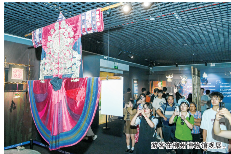
游客在柳州博物馆观展。