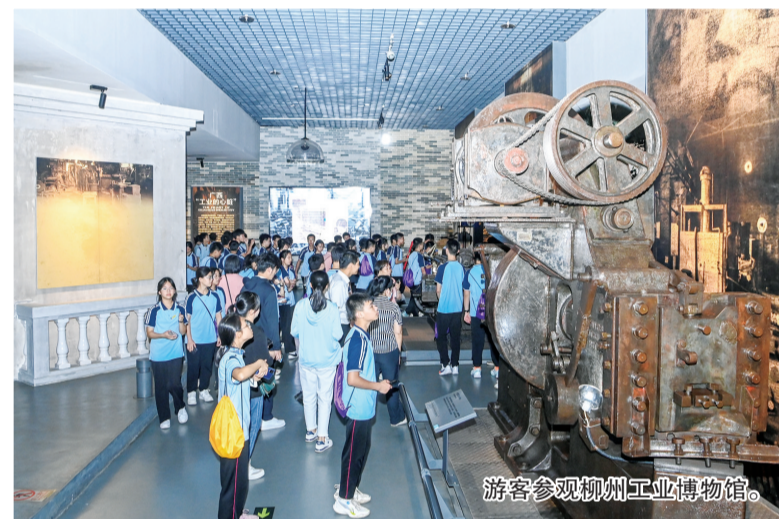
游客参观柳州工业博物馆。