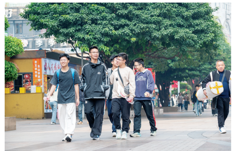
近日白天天气暖和，市民身着短袖、薄外套出游玩。