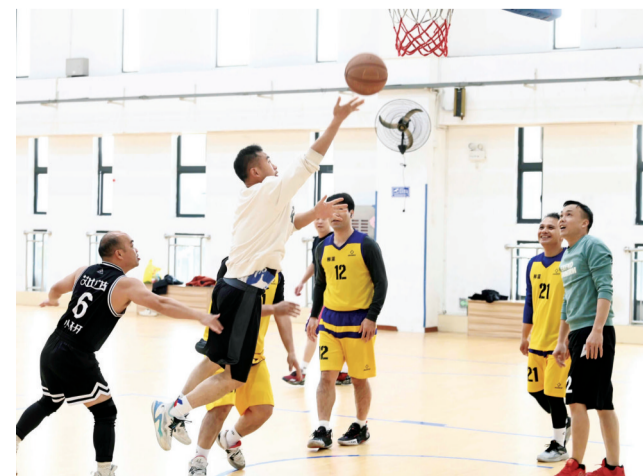
←市民在柳北体育园里的篮球场打球。