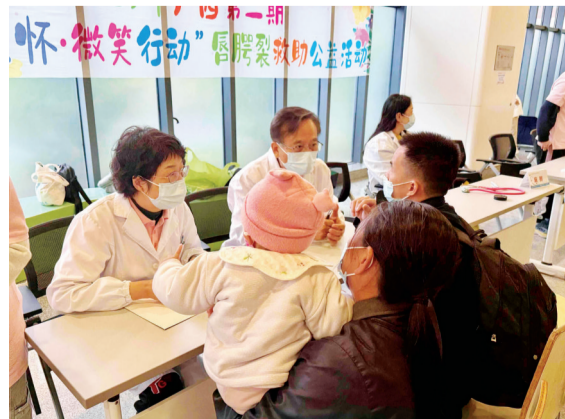
医护人员为患儿进行筛查评估。

日报消息（全媒体记者覃林薇报道摄影）12月12日上午，广西2025年第二期“生育关怀·微笑行动”公益活动（又称“母亲微笑行动”）在柳州市妇女儿童医疗中心柳州医院（以下简称“广妇儿柳州医院”）正式启动。本次活动通过免费筛查、手术治疗等方式为计生家庭唇腭裂患者提供救治，助力患儿重拾“自信微笑”。