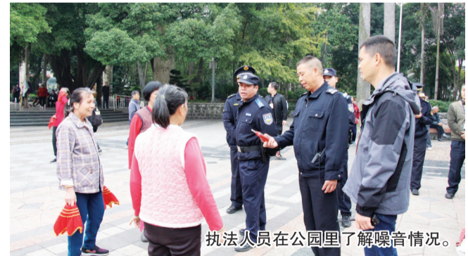
执法人员在公园里了解噪音情况。

下一步，鱼峰公园将继续巩固成果，将北门、青檀歌台等区域列为重点防控区，持续深化功能分区与文明宣传，推动整治成效常态化、长效化，让这一“山歌胜地”真正成为秩序井然、环境宜人、歌声悠扬的城市文明窗口。