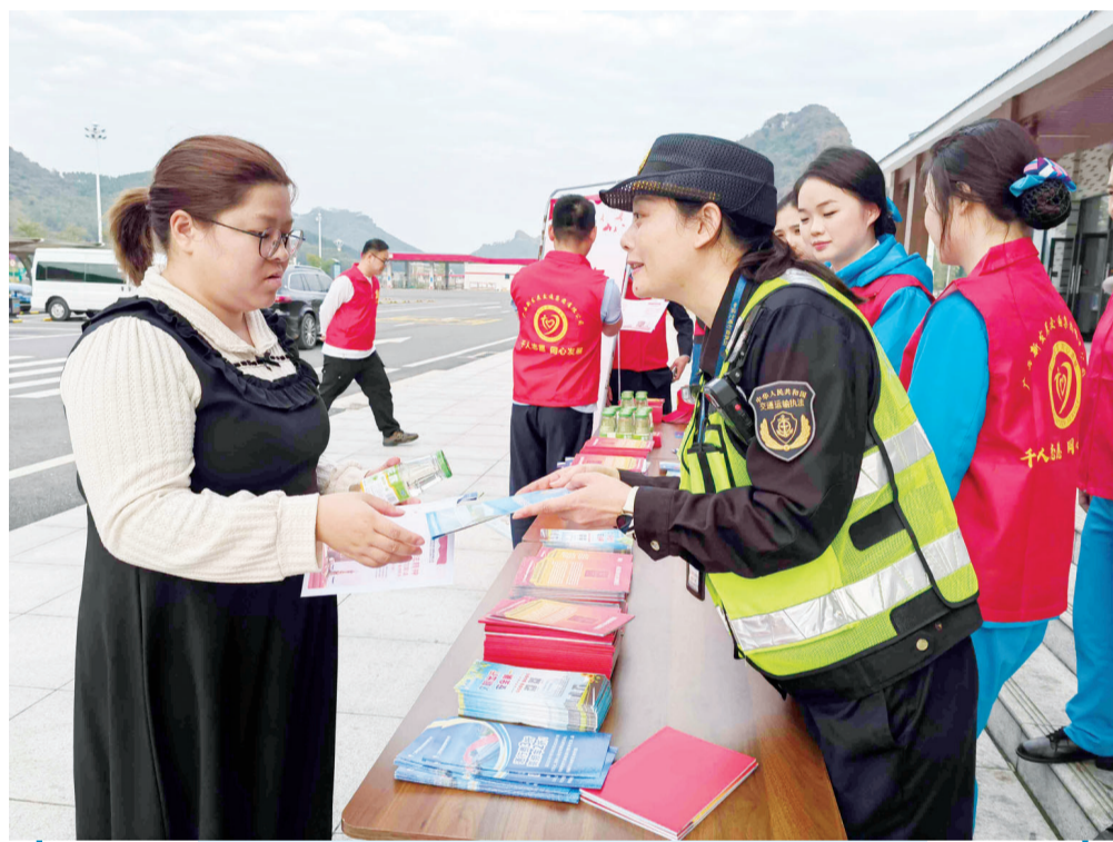
工作人员向过往的司乘人员宣传交通安全知识。

日报消息（全媒体记者张威、通讯员唐敏报道摄影）12月14日，记者从自治区交通运输综合行政执法局第三支队第五大队了解到，该大队近期联动我市相关部门开展高速公路交通安全提升行动，排查隐患保障交通安全。