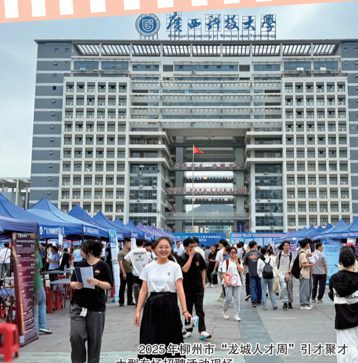
2025年柳州市“龙城人才周”引才聚才大型专场招聘活动现场。