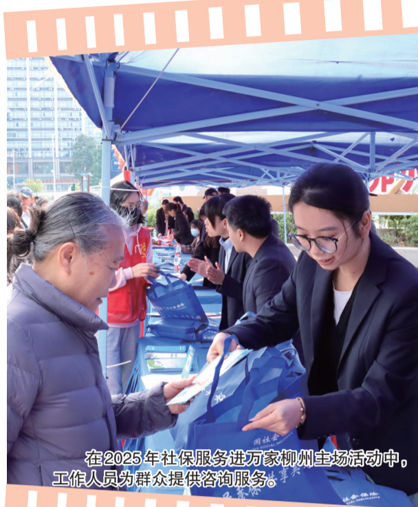
在2025年社保服务进万家柳州主场活动中,工作人员为群众提供咨询服务。