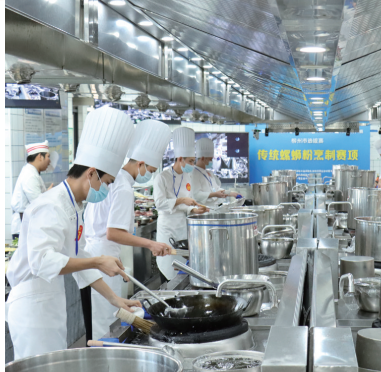
第三届广西乡村振兴技能大赛暨第九届广西农民职业技能大赛柳州市选拔赛精彩瞬间。

五年栉风沐雨,五年砥砺前行。回望过去5年,全市人力资源和社会保障工作深入贯彻落实习近平总书记关于广西工作论述的重要要求,坚持“实干为要、创新为魂,用业绩说话、让人民评价”,全力打好“稳就业、强保障、聚人才、筑和谐、优服务”组合拳,在服务发展大局中勇挑重担,在攻坚克难中砥砺前行,在实干担责中破局突围,谱写了昂扬奋进的民生篇章——就业形势持续稳定向好,社会保障体系日趋健全,人才引育留用质效同步提升,劳动关系和谐稳定局面不断巩固。全市人力资源和社会保障事业实现高质量发展,不断擦亮民生底色,提升人民幸福成色。