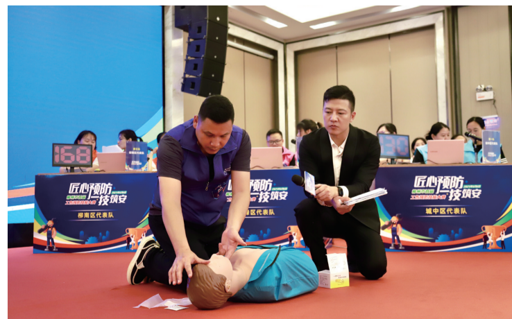
2025年柳州市首届工伤预防技能大赛现场。