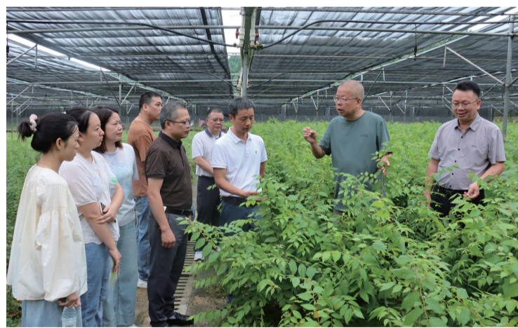
2025年“智汇基层 产智融合”乡村振兴专家服务团到融水苗族自治县调研。