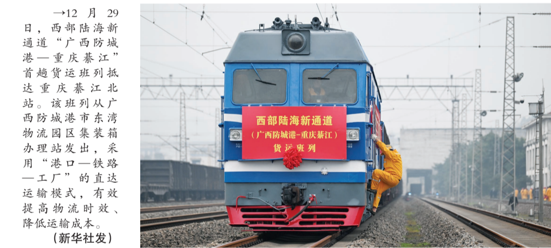
→12月29日,西部陆海新通道“广西防城港—重庆綦江”首趟货运班列抵达重庆綦江北站。该班列从广西防城港市东湾物流园区集装箱办理站发出,采用“港口—铁路—工厂”的直达运输模式,有效提高物流时效、降低运输成本。