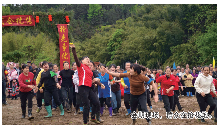
会期现场，群众在抢花炮。

紧接着，村民自编自演的歌舞、戏曲轮番登场，非遗手工展示区人头攒动，百年民俗的独特韵味扑面而来。这些承载着记忆与智慧的文化符号，不仅展现了龙妙村深厚的历史底蕴，也让百年民俗在新时代焕发出蓬勃生机。