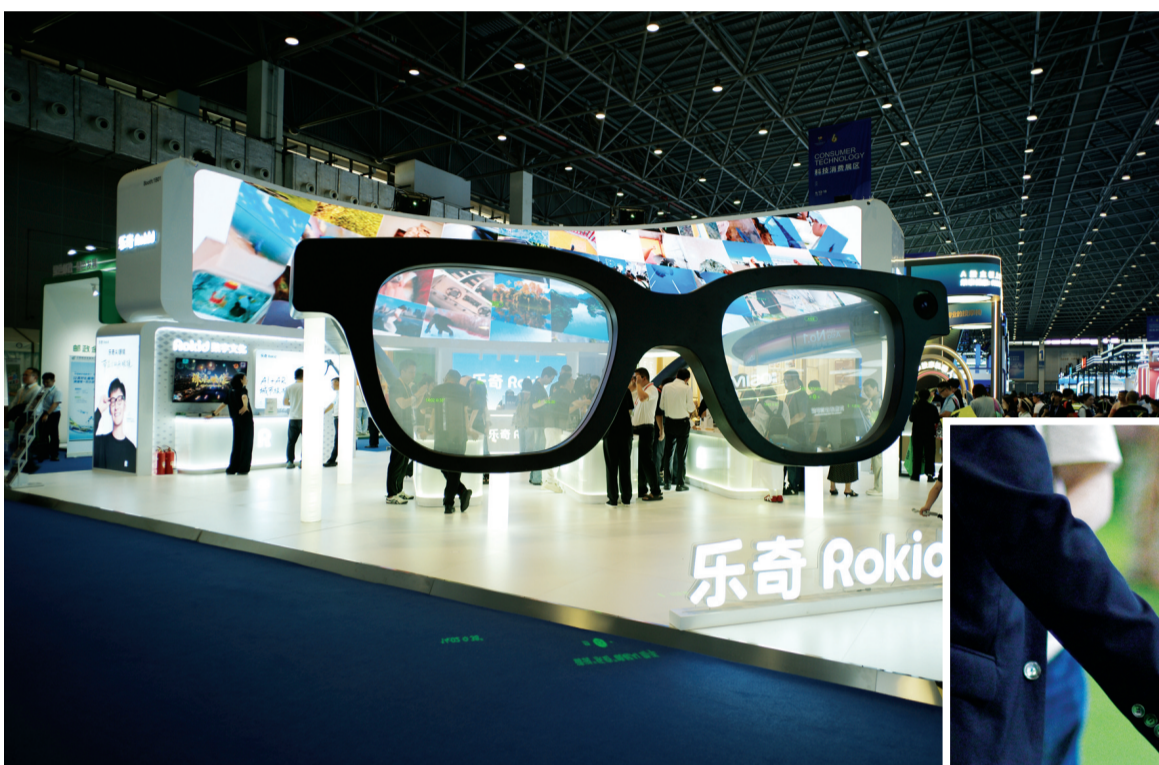
↑4月13日在第六届消博会科技消费展区拍摄的乐奇Rokid展台。