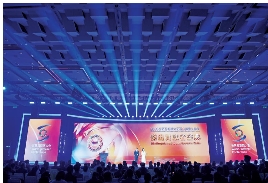
4月13日拍摄的2026年世界互联网大会亚太峰会主论坛暨杰出贡献者盛典现场。