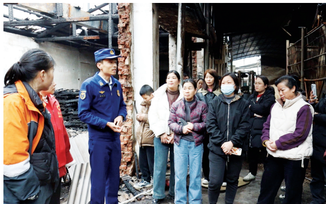
警示教育会现场。

警示教育会现场，消防员还重点讲解了企业在电气安全、通道管理、车间防火等方面可能存在的薄弱环节及日常排查整改的要点，并提醒企业代表，要制定好消防安全管理制度，开展应急演练，注意设施维护，明确责任人，完善“人防、物防、技防”三位一体的防火体系，避免发生火灾造成损失。