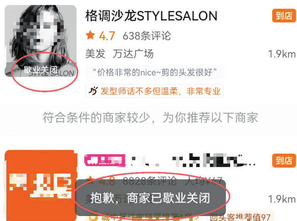
美团App上显示该店已歇业关闭。

在那家店的负责人，被告知那家店是最近新开的，和之前的格调沙龙美发店没有关系，要处理就找原来的美发店老板。该负责人还称，此前也有别的消费者来找过，但他们店也是爱莫能助。